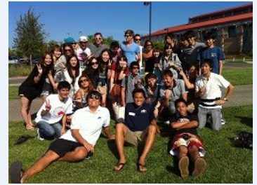
短期語学留学に参加した学生たち