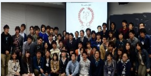
凸版印刷 最終プレゼンテーションに参加した学生たち