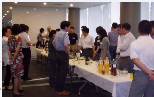
研修後の懇親会にて意見交換

9月4日の新任教員向けフォローアップ研修に参加しました。主要アジェンダは、①シラバスについて、②授業運営方法について、③成績評価について、④問題共有ワークショップ(WS)、と盛りだくさんで、これらを午前2時間、午後2時間というちょうどよい時間配分にて実施され、私にとっては非常に価値あるものでした。私は今年の3月まで企業に勤務していたため、着任直後の前期(4~7月)の講義では①~③について、いろいろ悩みながら過ごしてきました。非常勤講師等の経験は多かった方だと思いますが、ディプロマポリシー(DP)など3つのポリシーはみたことがありませんでしたし、よってシラバスもDPや履修モデルなどは考えずに作成しており、なんと効率の悪いことをやっていたかを再認識しました。この研修を通して、最も印象的だったのは、シラバス等における達成目標の重要性、そしてその適切な設定方法です。これが学生の評価にも直結しますし、どういう人材が育てて欲しいかという学部・学科・領域の方針の要素になってきます。また最後の問題共有WSでは、参加された先生方の授業や評価に関する工夫を全員で共有できて、いろいろヒントをいただきました。関係者のみなさま、ありがとうございました。私は次回はシラバスの書き方WSに参加予定ですが、このような研修は新任だけでなく、短時間でもよいので定期的にリマインドする機会などがあるとよいと感じています。