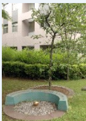
大宮キャンパス5号館前の「ニュートンのリンゴの木」

入試形態の中で、本学入学までに十分勉強してこなかった科目がある学生に対しても、講義内容を十分に理解できるよう個別の学習サポートを実施し、卒業時には本学卒業生として十分な能力・資質を備えていることを保証することが必要となります。これらの教育環境のソフトウェア部分での整備・改善を推進していく全学組織が教育イノベーション推進センターです。学生諸君が自らしっかりと学び、卒業後には社会からの期待に応えられるようなシステムづくりを目指していきます。さらには、世界的に広がっていくグローバル化やダイバーシティとしての男女共同参画等の喫緊の課題に対しても先進的に取り組んでいきます。