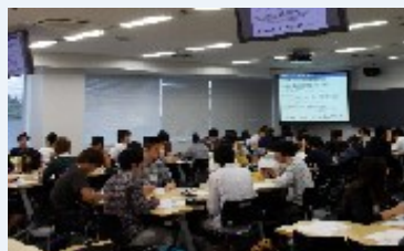
産学協同講座を受講する学生たち