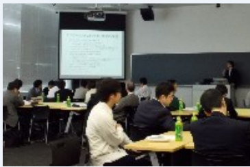
ワールドカフェ形式でのラーニング ポートフォリオ検討会 (2013/10/19 大宮キャンパス IRワークショップ)