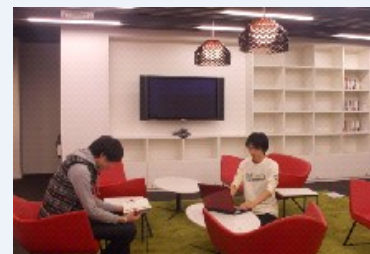
大宮キャンパス 5号館 多目的教室 一部をシステム理工学部の 学習サポートとして利用

新入学生を対象とした学部・学科オリエンテーション科目に「メンタルケア」に関する講義を組み込みたい、との要望が寄せられている。その要望に応えるため、本センターで、この講義を担当する全学向けの講師を準備することを考えている。詳細については、今後各学部と協議し進めることとしたい。