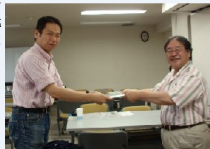
ティーチングポートフォリオ作成修了書を授与する水川工学部長

常々申し上げていますが、大学教員は無免許であるが故に、常に自らを高める努力をする自覚が必要です。その有効な一つの手段として、TPの作成をお薦めいたします。