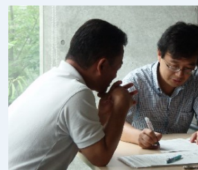
ティーチングポートフォリオ完成ワークショップ (2013/9/11 芝浦キャンパス)

他に提供するプログラムとして、「FD・SD講演会」「新任教職員研修」「入職3年目以内フォローアップ研修会」等があります。また、学外のFD集会情報をお知らせするMLもあります。