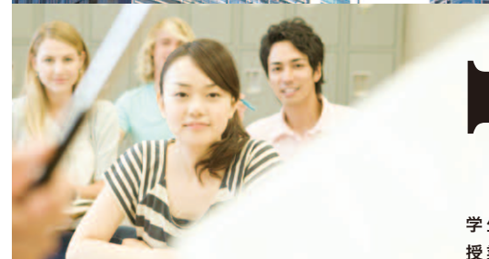
学生による 授業観察と情報提供